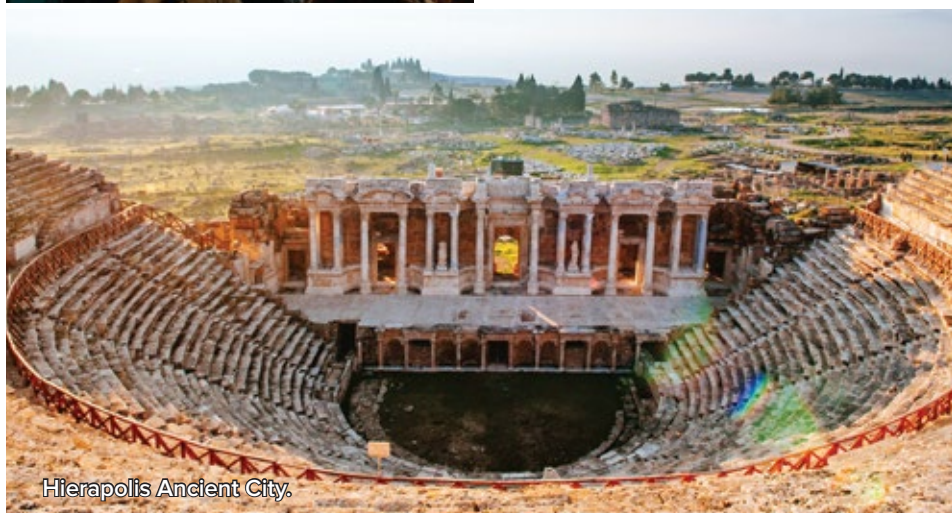
Hierapolis Ancient City.